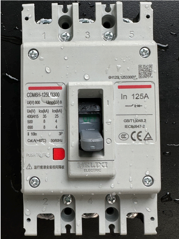
1# Ka: 盐雾（类别A）48h