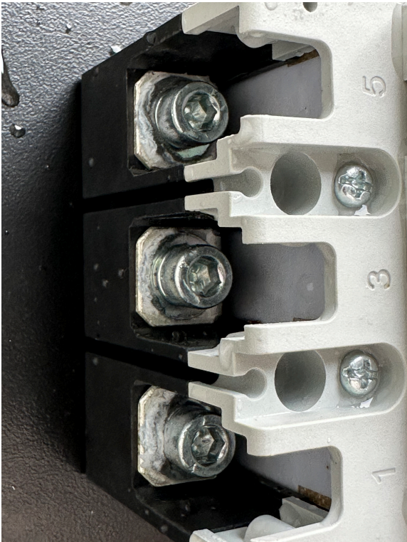
1# Ka: 盐雾（类别A）48h